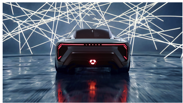
Exterior del Lexus LFA Concept