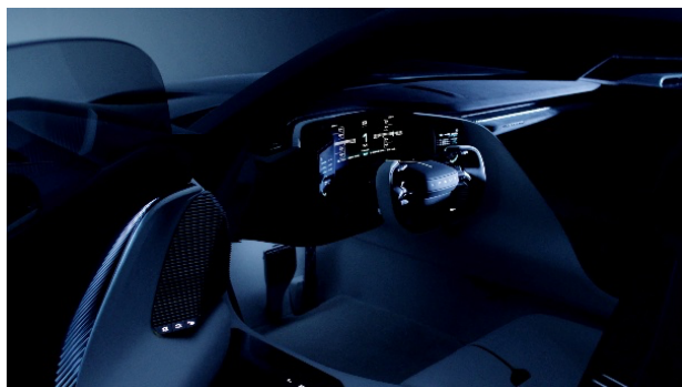
Interior del Lexus LFA Concept